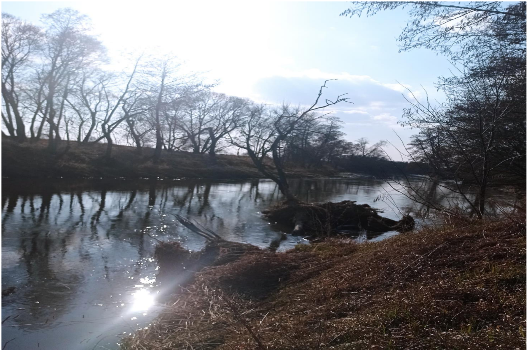
Ola Szkudlarek Stary Olesiec