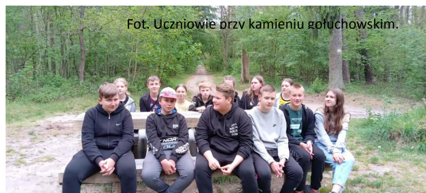
Fot. Uczniowie przy kamieniu gołuchowskim.

cymburgaia, siłowni zewnętrznej oraz leżakowania. Po obiedzie spędziliśmy najpierw czas w pokojach, a potem na plaży. O 15.00 posprzątaaliśmy swoje domki, zapakowaliśmy bagaże, zrobiliśmy zakupy i udaliśmy się w drogę powrotną do domu.