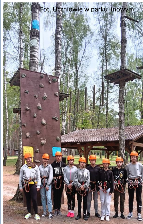
Fot. Uczniowie w parku linowym.

Były to dwa ciepłe, słoneczne, miłe i niezapomniane dni spędzone w Gołuchowie.