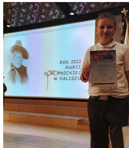
fot. Robert z dyplomem w auli uniwersytetu

23 maja w Auli im. prof. Jerzego Rubińskiego WPA Uniwersytetu im. Adama Mickiewicza podczas święta wyżej wymienionej szkoły nastąpiło wręczenie nagród.