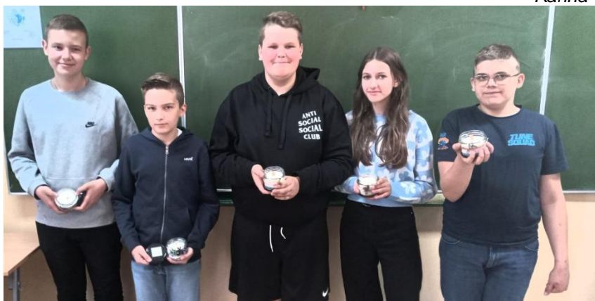
fotografie uczestników warsztatów