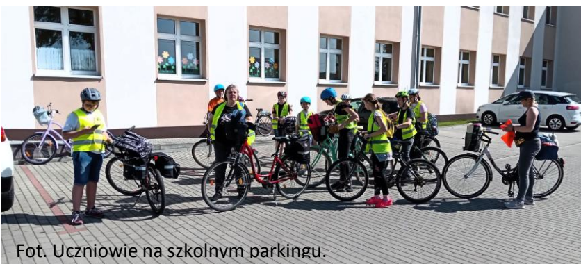
Fot. Uczniowie na szkolnym parkingu.

Bardzo serdecznie dziękuję Mamom, które razem ze mną opiekowały się młodzieżą podczas jazdy oraz pobytu w GOTIS.