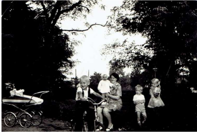
Chocz 1971 rok, w parku pl. 1. Maja.