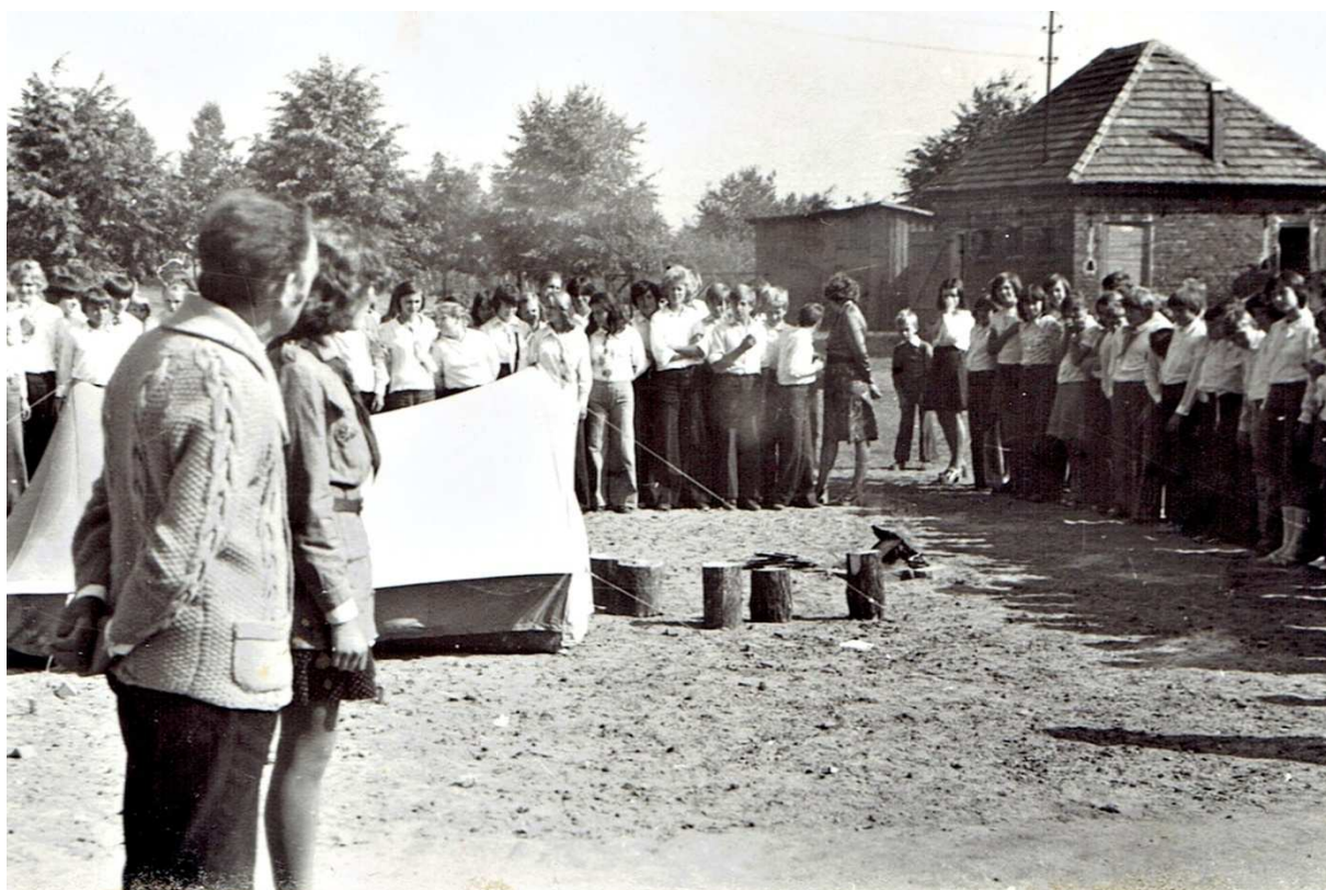
Lata 80-te Chocz.