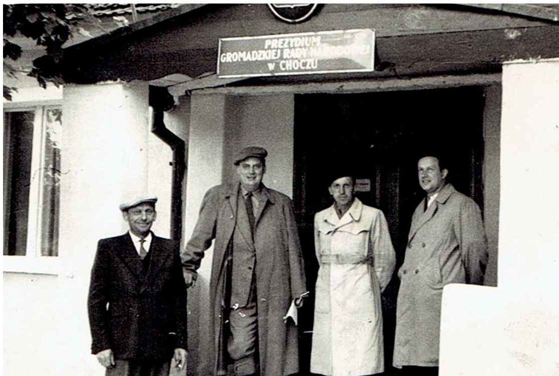
Chocz, lata 50 –te; przed budynkiem Prezydium Gromadzkiej Rady Narodowej. (J. Ciszewski)