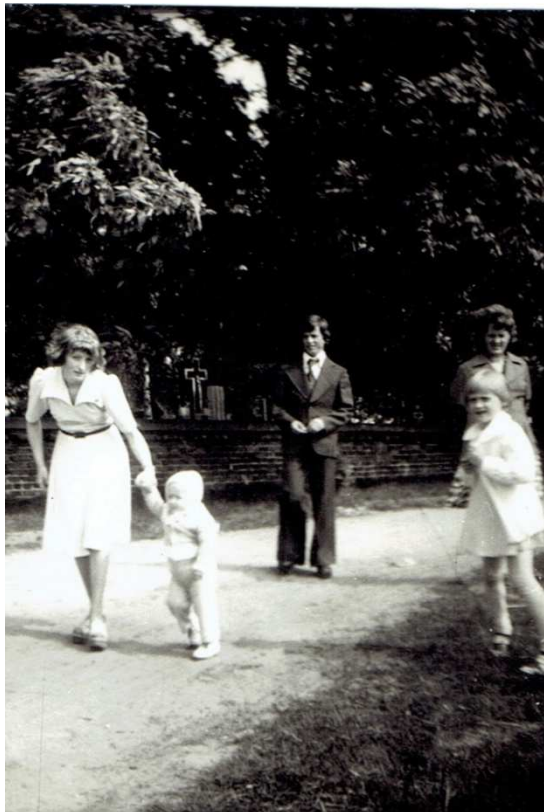
Chocz 1977 rok, przy cmentarzu.