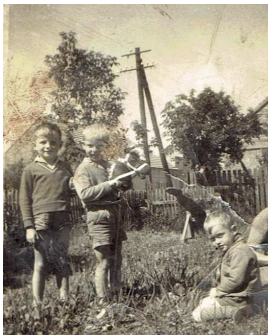
Chocz 1967 rok, ul. Pleszewska, plac przedszkolny