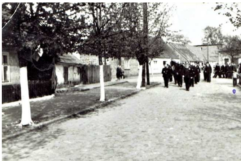
1 maja 1975 rok, plac 1 Maja. Defilada pierwszomajowa Ochotniczej Straży Pożarnej w Chocz.