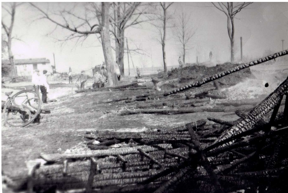
Początek lat 80-tych. Chocz. Pogorzelisko po stodołach.