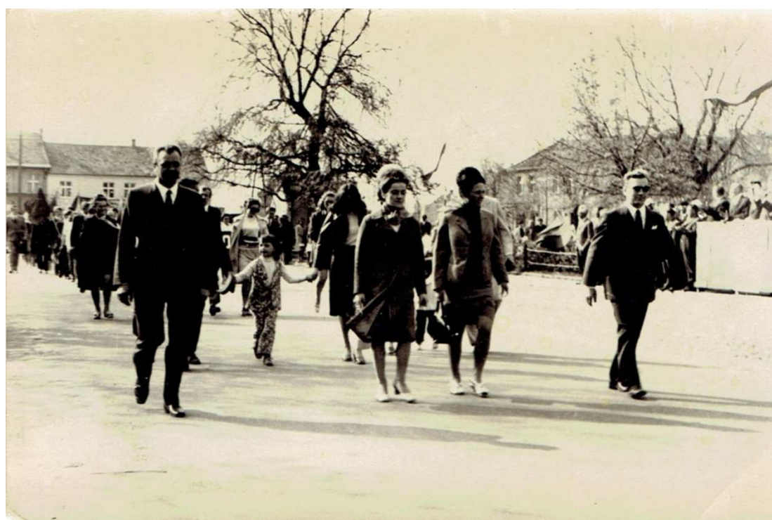
1 maja 1972 rok, plac PKWN w Choczu. Defilada pierwszomajowa.