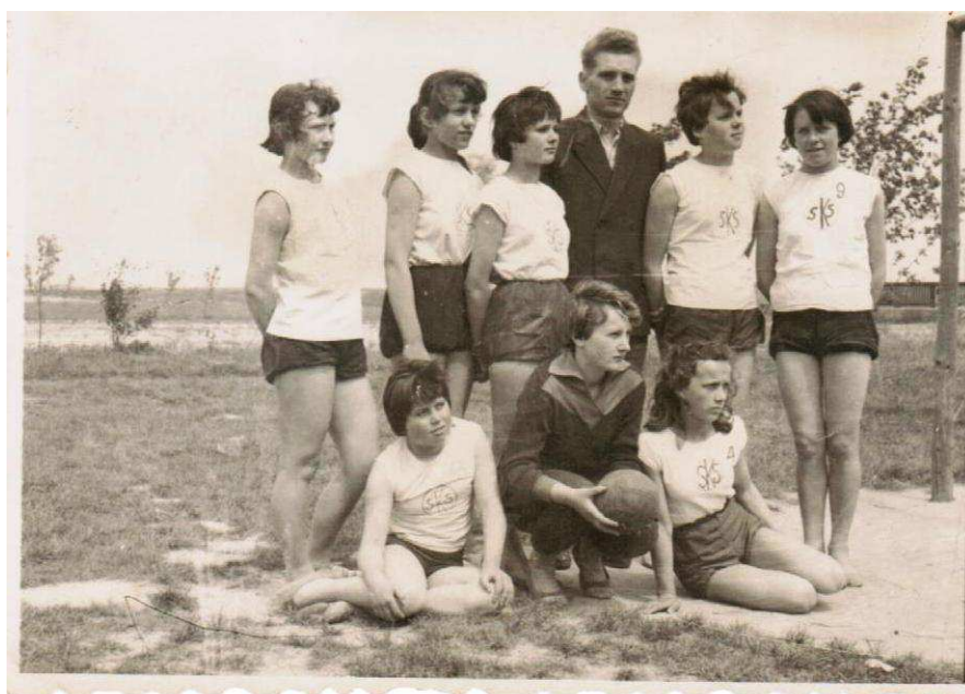
Początek lat 80-tych.