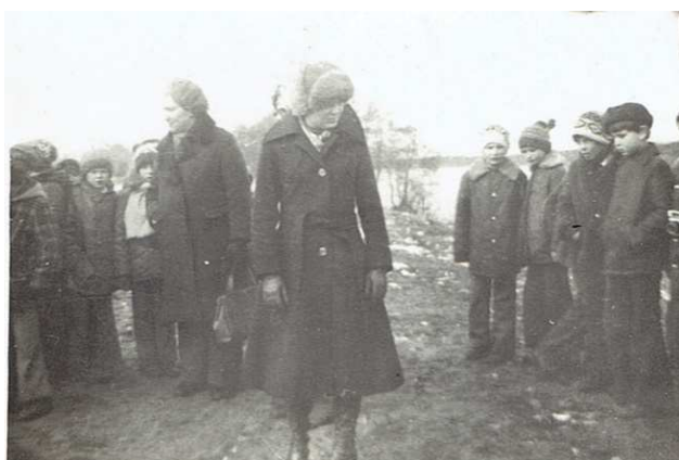
21 marca 1978 roku – nad brzegiem Prozny. Pożegnanie zimy, powitanie wiosny.