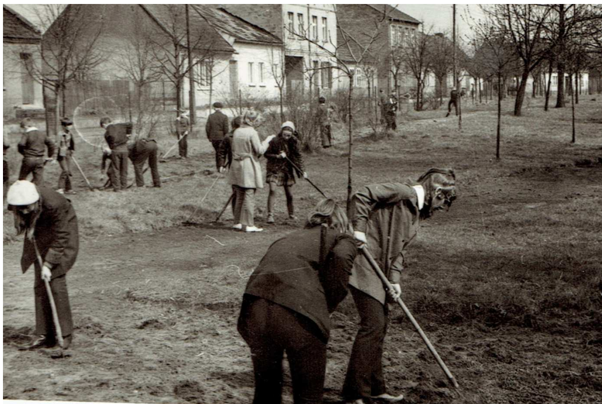
Lata 80-te. Chocz. Czyn społeczny w parku (wówczas placu PKWN)