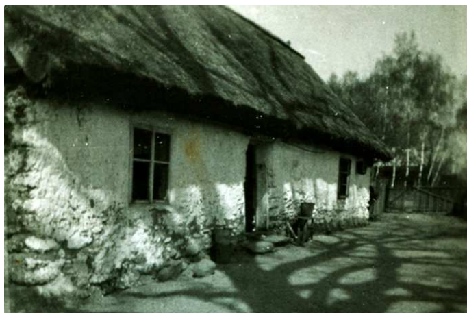
Nowolipsk lata 70;