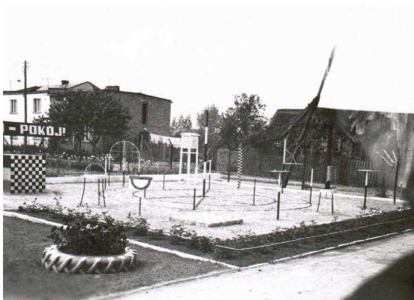
Lata 80-te ogródek geograficzny przy szkole w Choczcu.