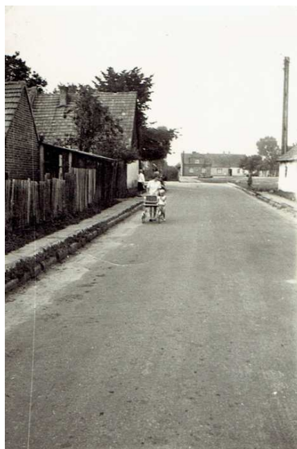
Chocz 1968 rok, ul. Kaliska