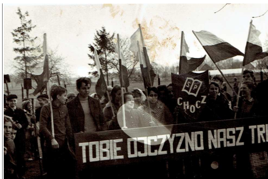
Lata 80 -te. Chocz. Pochód pierwszomajowy.