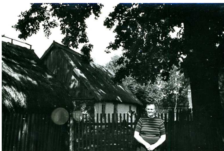
Nowolipsk lata 70; przed domem rośnie duży dąb (obecnie pod ochroną – pomnik przyrody)