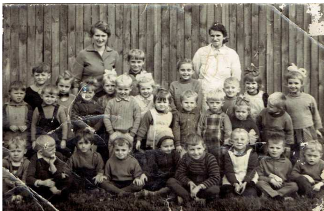
Chocz 1966 rok, ul. Pleszewska, przedszkole