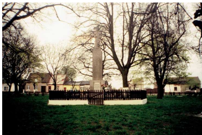
1999 r. Chocz; pomnik św. Wawrzyńca w parku przy pl. 1 Maja