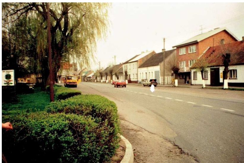
Chocz , Rynek 1999