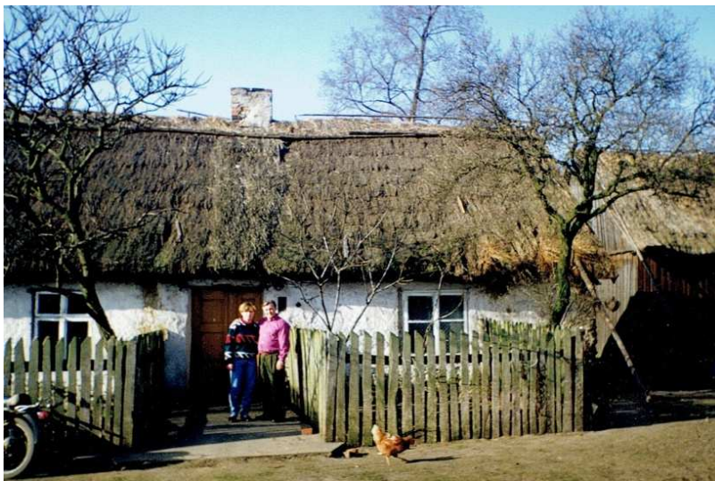
Nowolipsk, 1990 rok. mieszkanie państwa Latańskich.