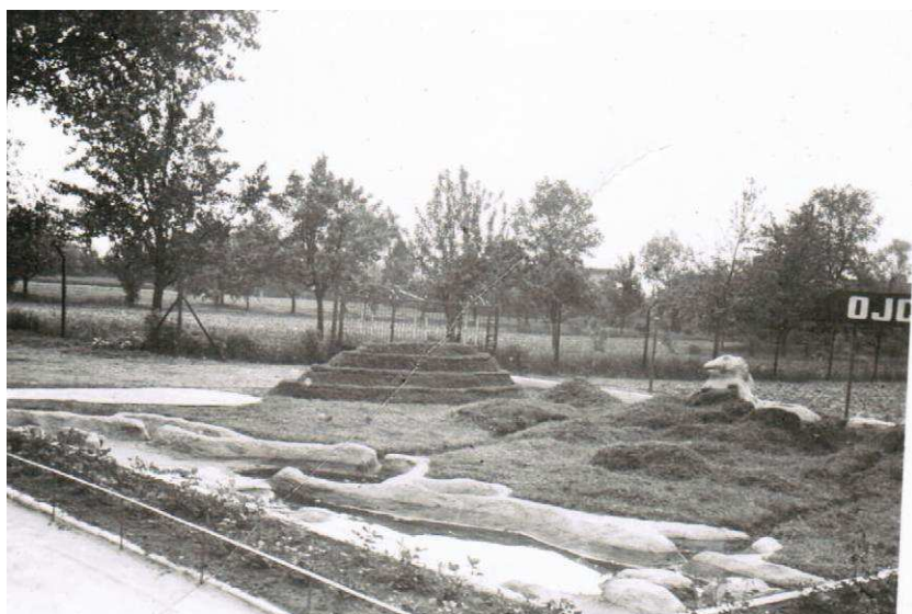
Lata 80-te Ogródki szkolne przy szkole w Choczcu.