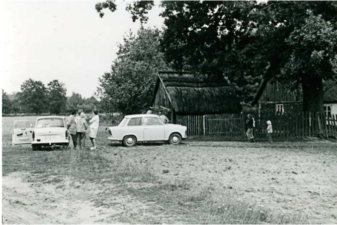
Nowolipsk lata 70- te;