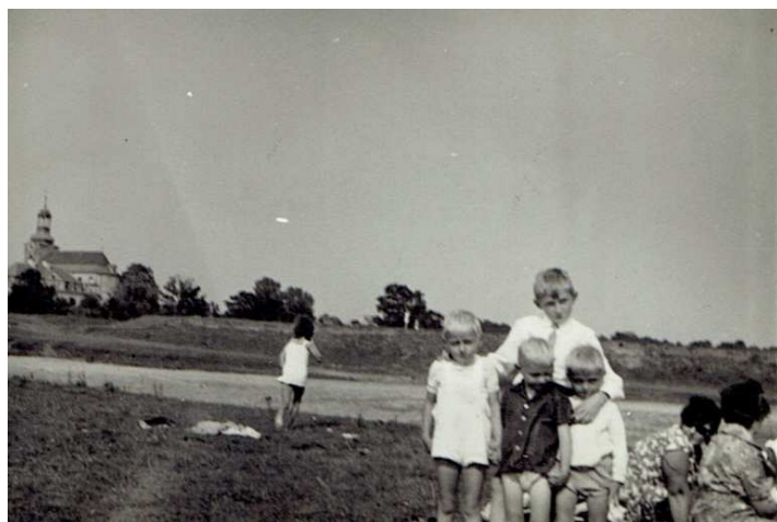
Chocz 1970 rok, nad rzeką Prosną.