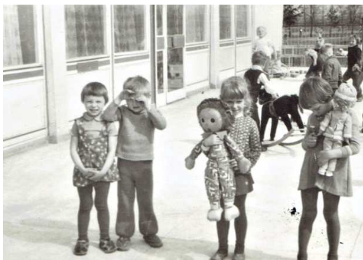
Wiosna 1978 rok – zabawy dzieci na tarasie w przedszkolu w Chocz.