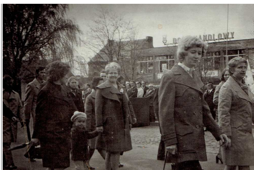
1976 rok. Chocz. Pochód pierwszomajowy.