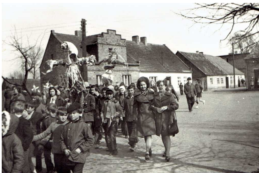
Lata 80-te. Chocz. Topienie marzanny. Spacer ze szkoły w kierunku Proсны.