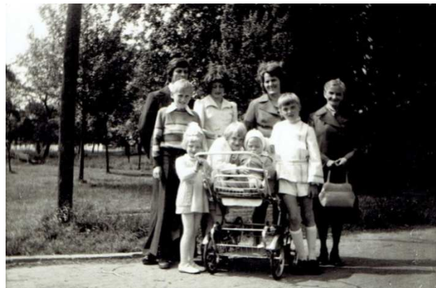
Chocz 1977 rok, pl. 1. Maja park w tle.