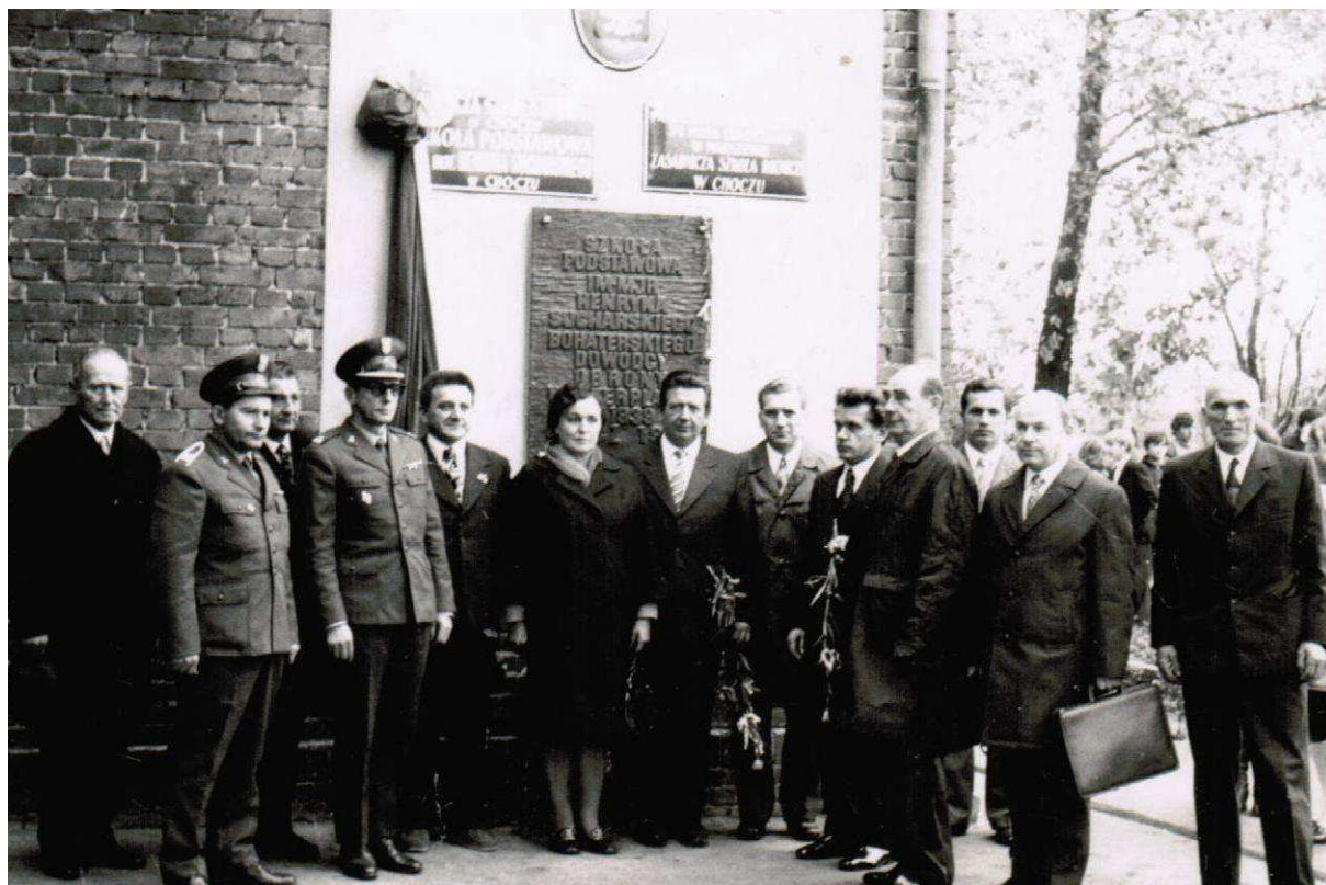
Chocz 1973 r. Nadanie szkole imienia mjra H. Sucharskiego.