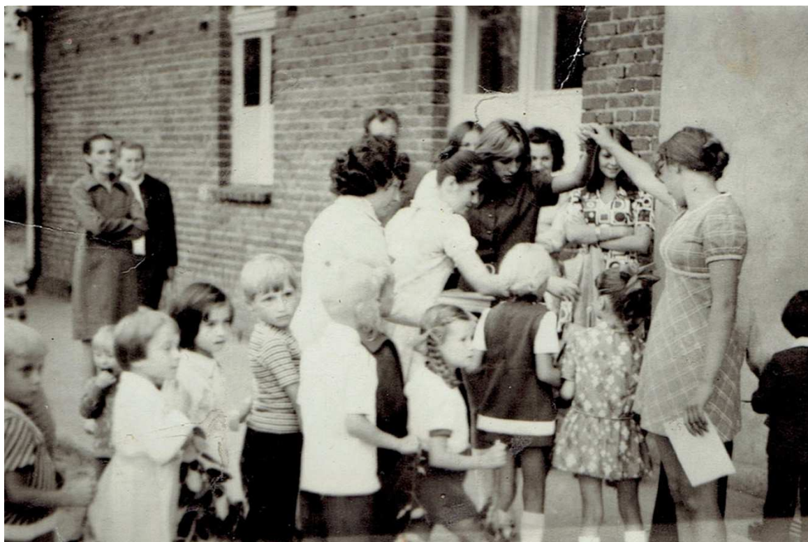
31 sierpnia 1974 roku, boisko szkolne w Chocz. Pierwszoklasiści przechodzą przez bramę pisania i otrzymują zeszyt.