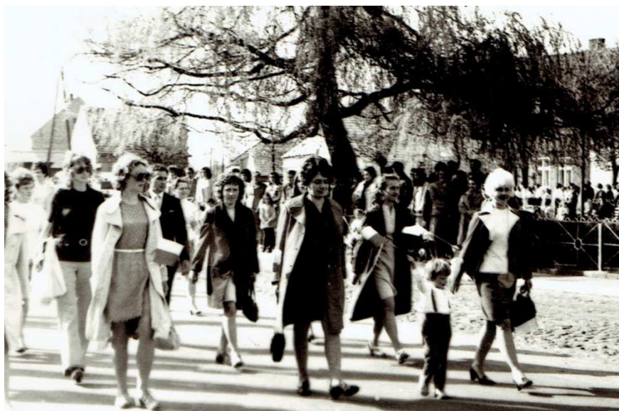
Lata 80-te Chocz – ówczesny pl. PKWN Obchody 1 maja.