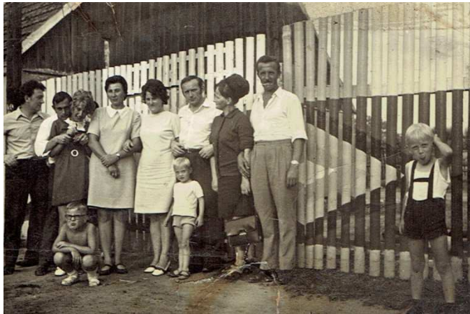
Chocz 1972 rok, ul. Kaliska