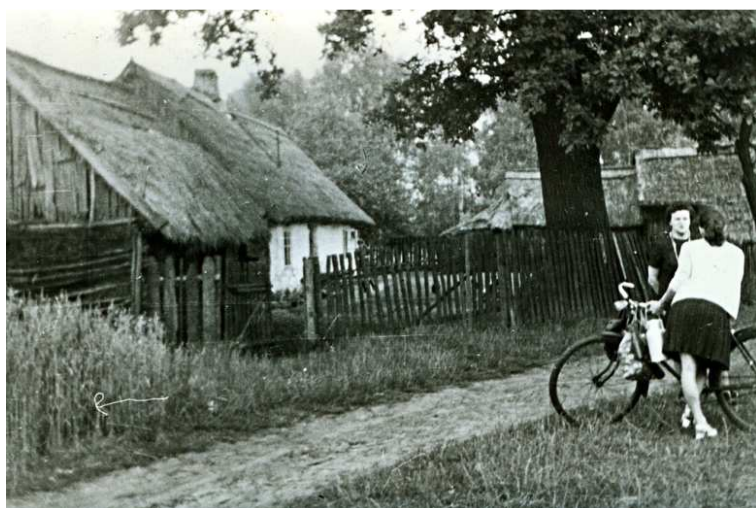
Nowolipsk lata 70;