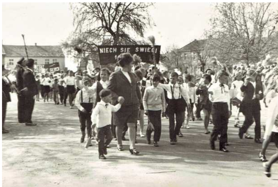
1 maja 1972 rok, plac PKWN w Choczu. Defilada pierwszomajowa.