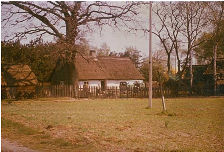
Nowolipsk, lata 70- te;